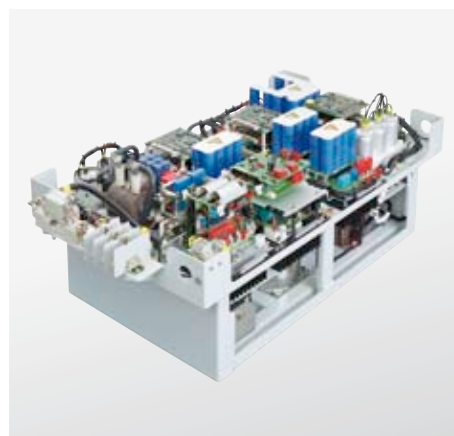
Bordnetzumrichter Kiepe BNU 505

Die meisten Steuerungsfunktionen werden über ein standardisiertes Datenbussystem auf CANopen-Basis abgewickelt. Alle sicherheitsrelevanten Funktionen werden zusätzlich mittels separater Steuerleitungen übertragen, die gleichzeitig die Rückfallebene bei Busausfällen bilden.